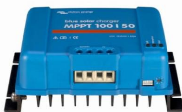
Controlador de carga solar MPPT 100/50